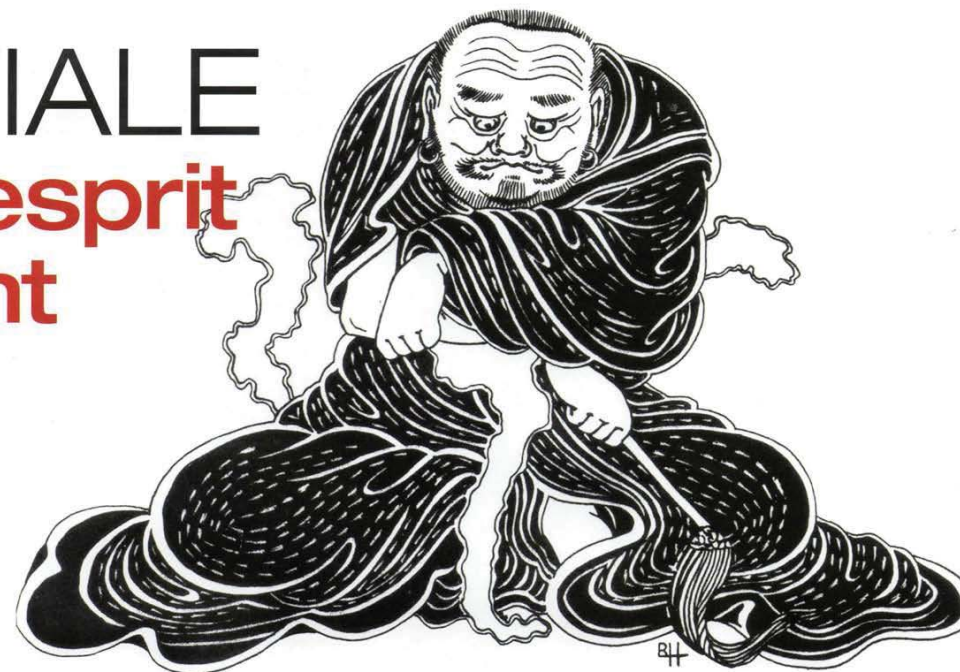
Un Roshi: vieux (vénérable) maître, incarnant la Sagesse. Dessin de R.Habersetzer, dans "Encyclopédie des arts martiaux de l'Extrême-Orient", Editions Amphora (copyright).

ne veulent surtout être contraintes par rien, obnubilées par la recherche de leur bonheur immédiat. La tradition, gelée dans son emballage d'origine, est en train de tourner à la langue morte. Doucement, mais sûrement. Ce qui est aujourd'hui advenu des arts encore dits "martiaux", je l'annonçais depuis longtemps, sans dévier d'un discours toujours repris, dans une récurrente "chronique d'un désastre annoncé". Ces arts gardent certes leurs experts qualifiés, motivés, respectables, encore suivis par certains publics, mais de plus en plus relégués dans quelques cercles réservés où ils sont incontournables mais aussi de moins en moins efficaces quant à la portée de leur enseignement. Ancrés hors du monde réel, et de la nécessité d'y apporter des réponses urgentes et efficaces, donc crédibles. Au-delà de ces cénacles restreints s'agit une masse de gens qui n'ont plus accès qu'à des copies largement édulcorées de segments d'une tradition malménée par des générations où l'on est "vieux" de plus en plus vite, gagnées par des concepts de vie et des vocabulaires qui les coupent rapidement, et toujours plus (car le décalage s'accélère), du monde de leurs aînés. Alors, quel poids peut encore avoir