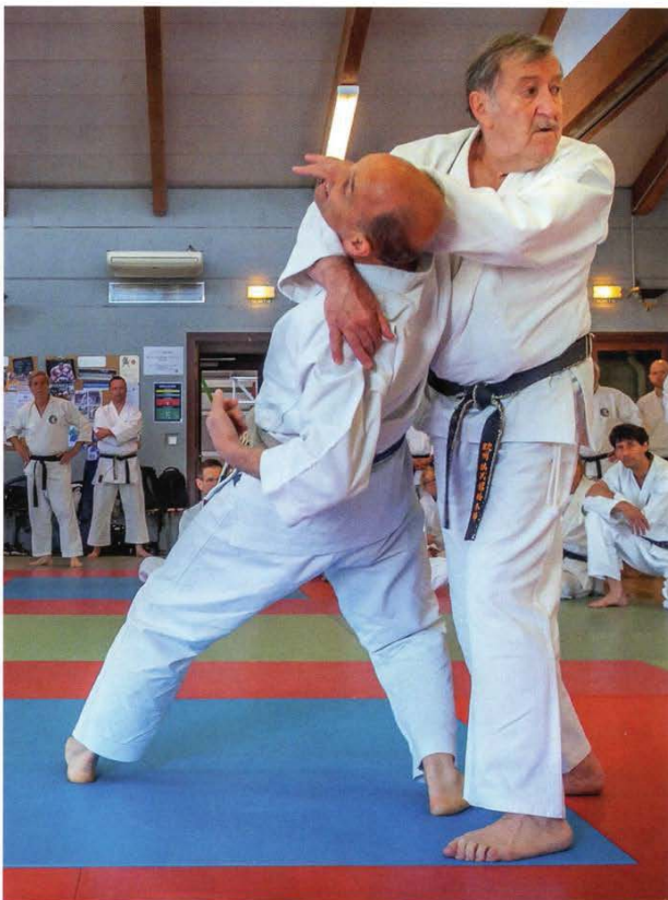
En combat de survie la prudence élémentaire consiste à se préoccuper de la présence d'autres adversaires pouvant survenir d'un angle mort alors même que le premier est sous contrôle (vision périphérique: un des piliers de l'enseignement de Sensei Habersetzer dans son Tengu-ryu Karatedo. Ici au cours de son dernier stage de Strasbourg.).

Je m'acharnais, à partir d'un travail et d'une réflexion de fond. Quasi quotidiennement.